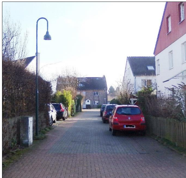
Verbindung zwischen Ost- und Westzufahrt etwa parallel zum Brander-Feld-Weg