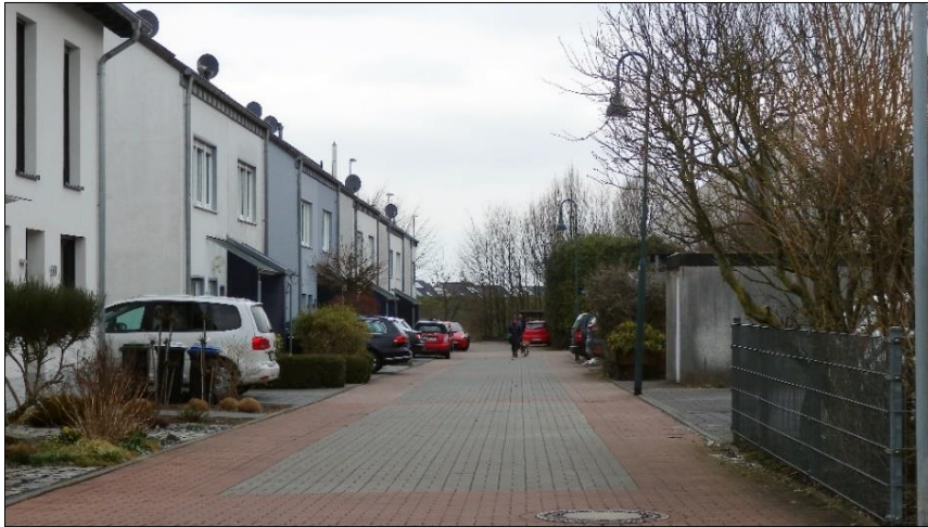
Blick von der Franz-Wallraff-Straße in die Straße Am Bollet (Westzufahrt)