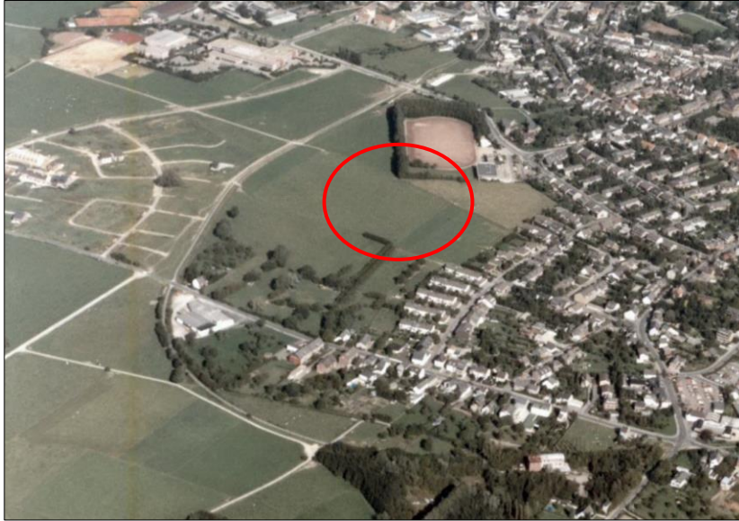
Luftbild der Flur „Bollet“ (Markierung) vor der Bebauung