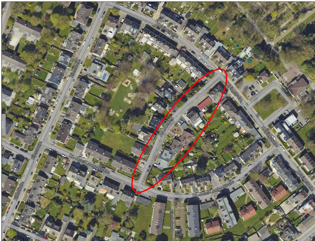
Luftbild Stadt Aachen: Die Daten basieren auf Auszügen aus dem ATKIS-Basis-DLM mit der Aktualität Dezember 2018 und dem Liegenschaftskataster (ALKIS) mit der Aktualität Juli 2018.