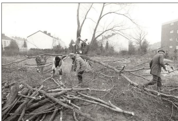
Rodungsarbeiten Am Hoerfeld im Jahr 1989