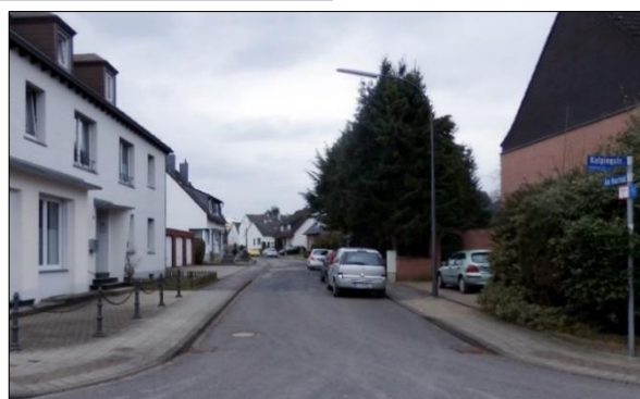
Ansicht von der Kolpingstraße