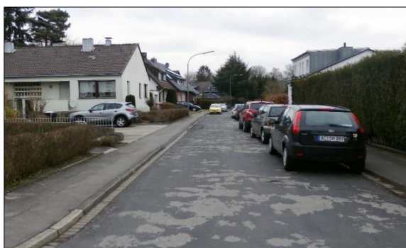
Ansicht von der Dr.-Josef-Lamby- Straße