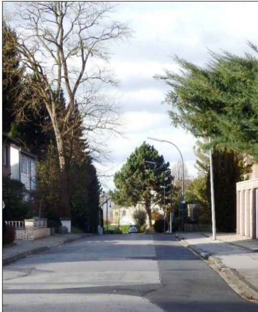
Blick von der Niederforst- bacher Straße / Einmün- dung Arensgasse in die Straße Am Pannes in Richtung der Straße Im Brander Feld