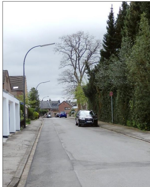
Blick von der Straße Im Brander Feld in die Straße Am Pannes