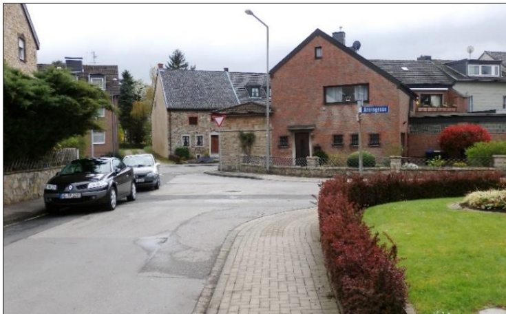
Blick auf die Einmündung der Arensgasse (rechts) und auf die Einmündung in die Niederforstbacher Straße