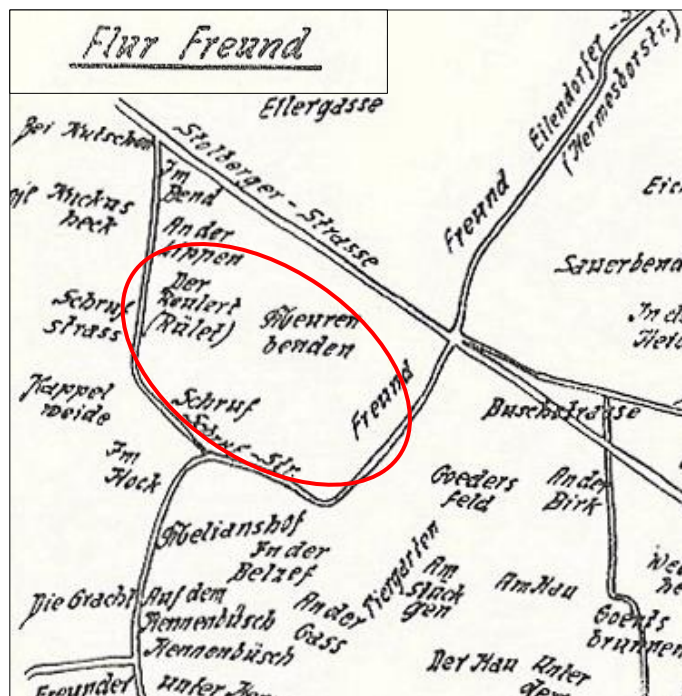
Auszug aus einer Skizze zum Bericht „Die Brander Ortslage nach den Flurkarten“ von Franz Wallraff (Stand 1936 4 )

Franz Wallraff stellt die Flurbezeichnungen, in denen die Georgstraße liegt, in seinem Bericht „Die Brander Ortslage nach den Flurkarten“, wie folgt dar: