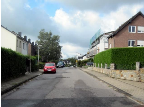
Blick von der Schroufstraße