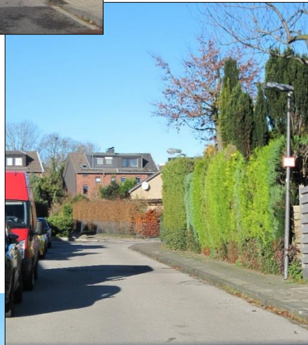
Blick von der Georgstraße in die Straße Am Reulert