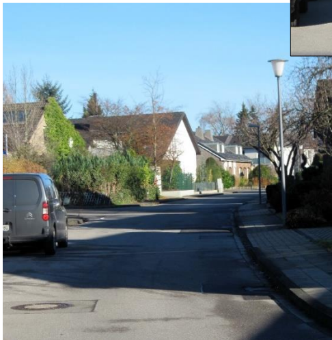
Blick in den westl. Teil des neben der Kleinbahnstraße liegenden Straßenbereichs