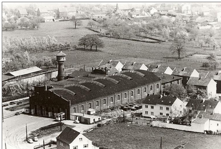
Hinter dem Kleinbahndepot die noch unbebaute Flur „Der Reulert“