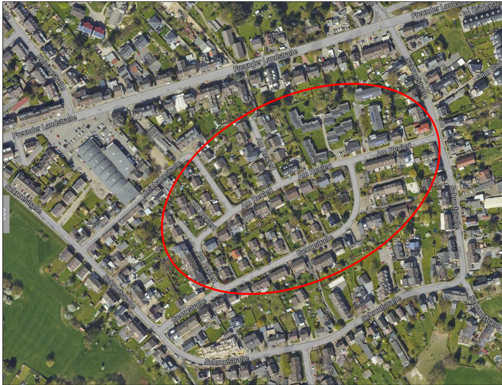
Luftbild Stadt Aachen: Die Daten basieren auf Auszügen aus dem ATKIS-Basis-DLM mit der Aktualität Dezember 2018 und dem Liegenschaftskataster (ALKIS) mit der Aktualität Juli 2018. (Land NRW)