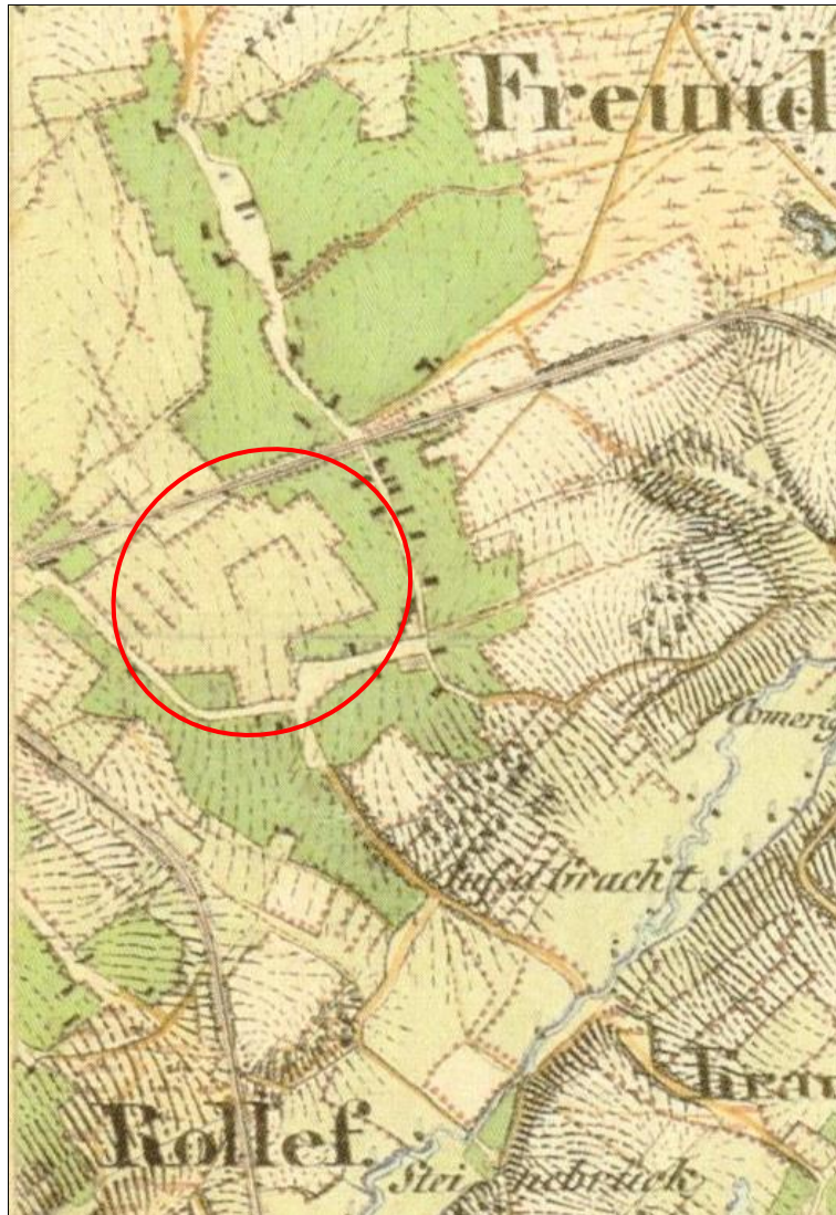
Auszug aus der Karte von 1846 – preußische Uraufnahme M.: 1:25.000

Der südl. Bereich von Freund - etwa als Halbkreis um die heutige Schroufstraße, vereinzelt sind Anwesen an der Straße erkennbar.