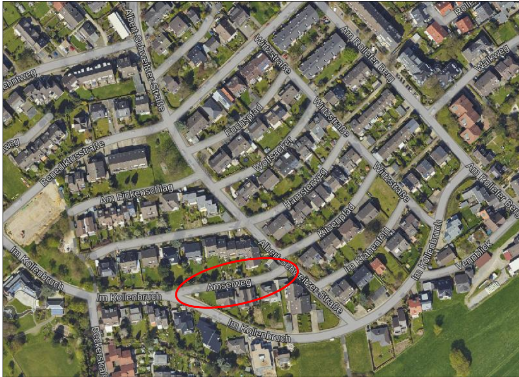
Luftbild Stadt Aachen: Die Daten basieren auf Auszügen aus dem ATKIS-Basis-DLM mit der Aktualität Dezember 2018 und dem Liegenschaftskataster (ALKIS) mit der Aktualität Juli 2018. (Land NRW)