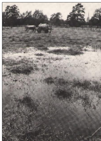
Im Kollenbruch in den 1960er Jahren