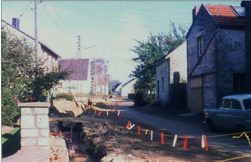
Kabelverlegearbeiten in der Arensgasse – zweites Haus rechts das „Arenshüsje“