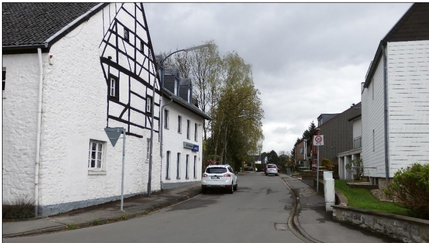
Blick von der Münsterstraße in die Arensgasse