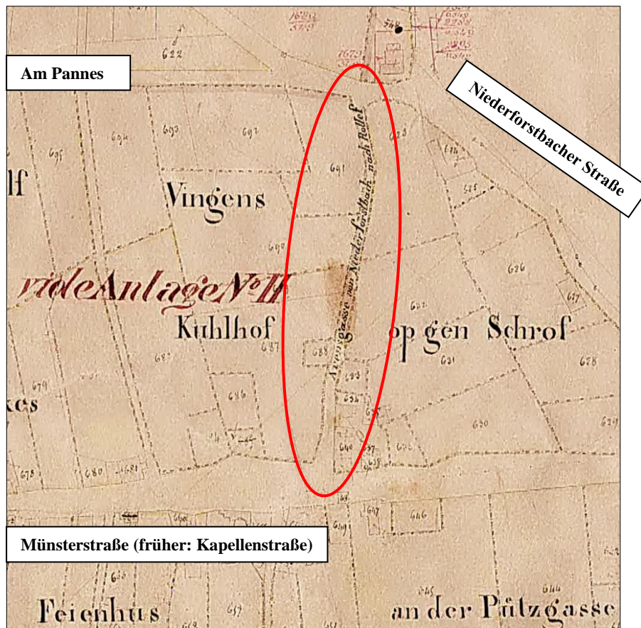
Auszug aus Urkatasterkarte von 1826: Zwischen Münsterstraße und Niederforstbacher Straße; Schriftzug: „Arensgasse von Niederforstbach nach Rollef“

Die Gasse wurde nach der damals dort wohnenden einzigen Anwohnerfamilie Arens benannt, die in einem kleinen Haus Nr. 2 („Arenshüsje“) lebte. Die Namen wechselten von Arensgasse in Ahrensgasse, Giefegasse = Wingengasse und war bis 1906 eine Wegeabkürzung zwischen Rollef (Pfarrkirche und Schule) und Niederforstbach (Dorfmitte und Vinzenzkapelle).