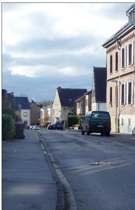
Ansicht von der Straße Am Pannes in die Arensgasse