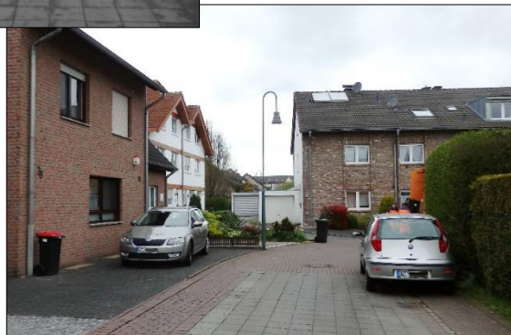
Blick in den Astenetweg von der Dr.-Bernhard-Klein-Straße, südliche Zufahrt