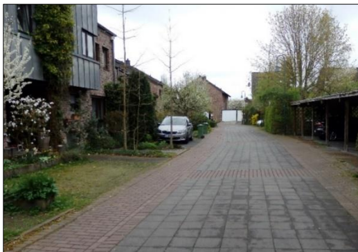
Blick in den Astenetweg von der Dr.-Bernhard-Klein-Straße, nördliche Zufahrt