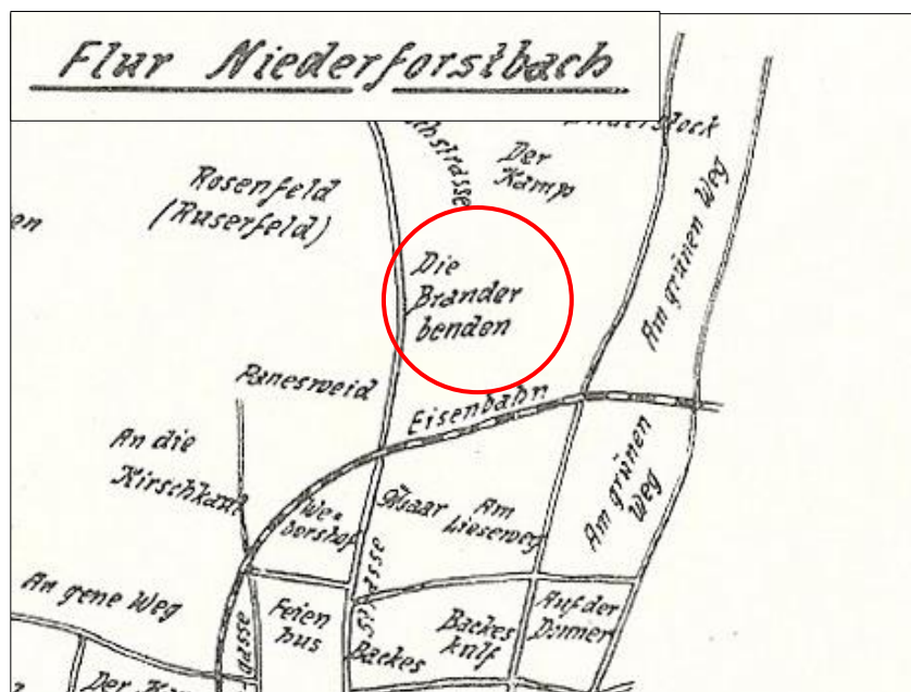
Auszug aus einer Skizze zum Bericht „Die Brander Ortslage nach den Flurkarten“ von Franz Wallraff (Stand 1936 4 )

Der Weg liegt nach den Aufzeichnungen von Franz Wallraff in der alten Flurbezeichnung Brander Benden.