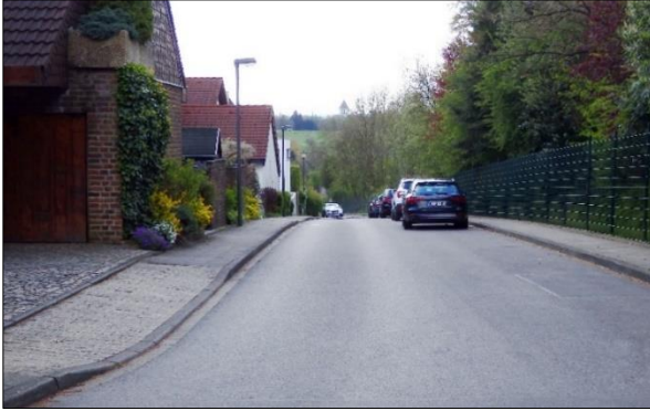
Sicht in die Beckerstraße von der Straße Im Kollenbruch