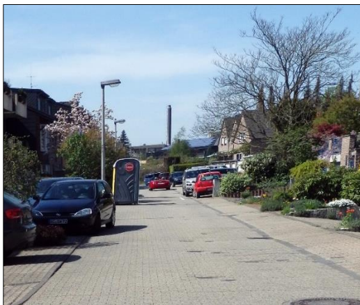
Blick in den Wohnstraßen- bereich der Beckerstraße vom Wendehammer aus