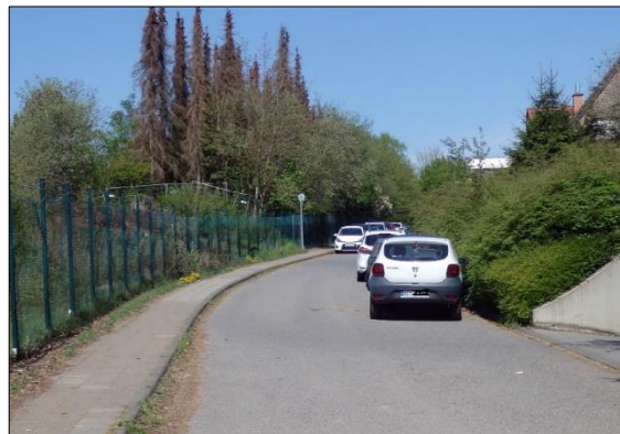
Einsicht vom Vennbahnweg