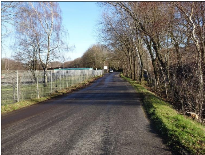
Blick in die Straße Camp Pirotte von der Kreuzung Ge- werbepark Brand / Im Erdbeerfeld zur Einfahrt Kompostanlage