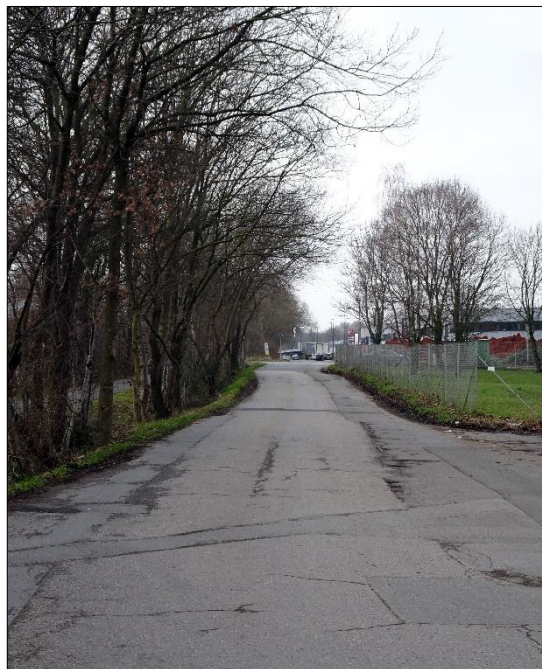
Blick zur Kreuzung Gewerbepark Brand / Im Erdbeerfeld