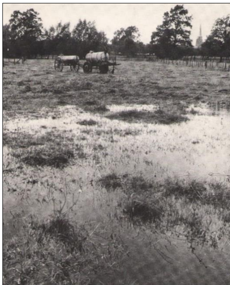
Im Kollenbruch in den 1960er Jahren