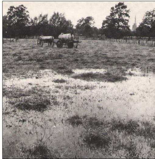
Im Kollenbruch in den 1960er Jahren