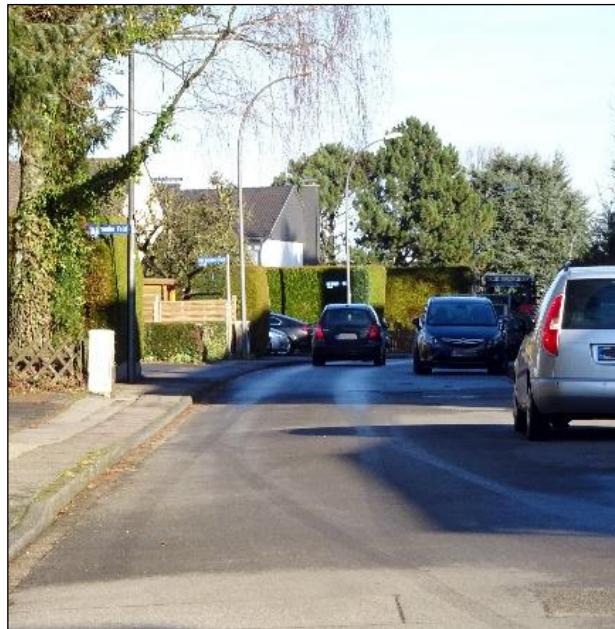
Blick in die Straße von der Einmündung in die Münsterstraße