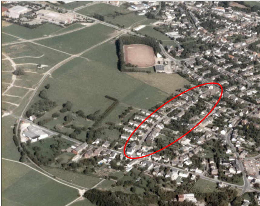
Hist. Luftbild von Teilen des Branderfelds und Niederforstbachs; ehemalige Flurbezeichnung „Im Branderfeld“; die Lage des heutigen Straße Im Brander Feld ist markiert.