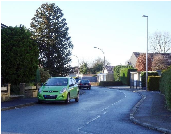
Einfahrt in die Straße Im Brander Feld von der Wolferskaul