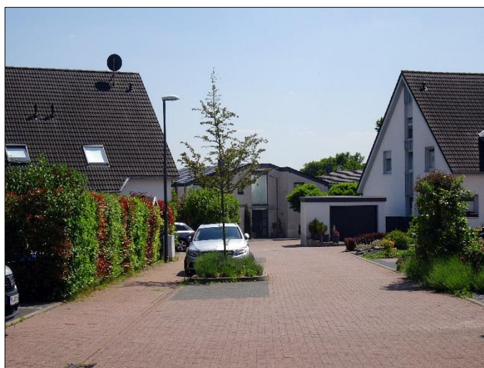
Blick in Richtung Wendehammer