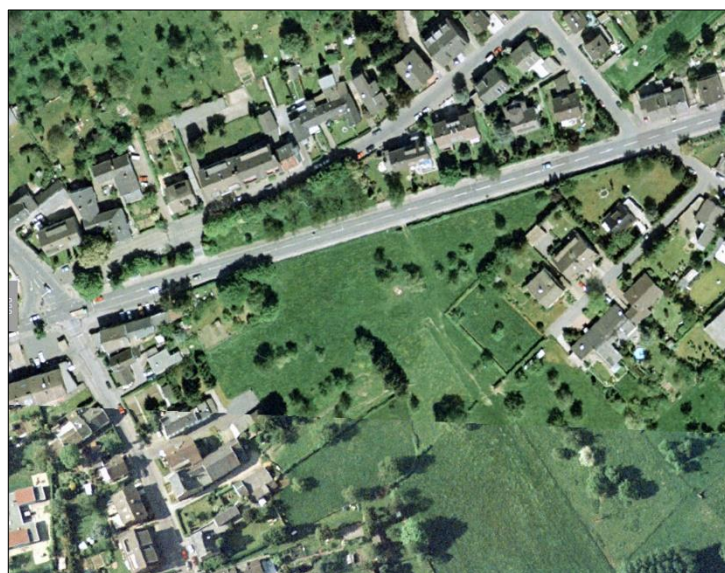
Die örtliche Situation im Luftbild der Stadt Aachen von 1998