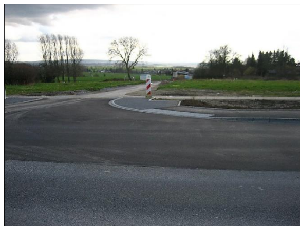
Ausbau an der Freunder Land- straße für die Zu- fahrt zum künftigen Wohngebiet in 2007