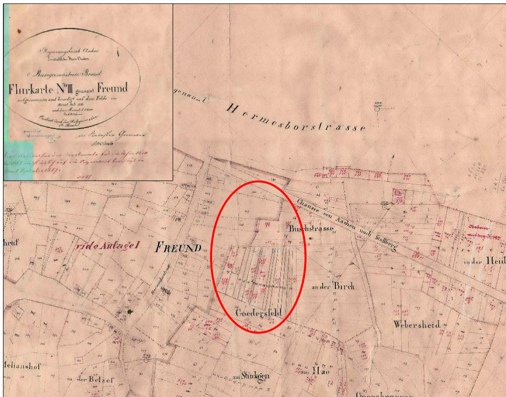
Auszug aus dem Urkataster der Gemeinde Brand, hier: Freund

Das Gelände der Flur Goedersfeld ist – wie man der Urkatasterkarte entnehmen kann – unbebaut und wird vermutlich landwirtschaftlich oder als Weide- oder Wiesenland genutzt.