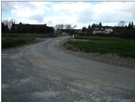
Baustraße im Baugebiet Anfang 2007