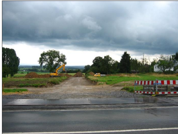
Erste provisorische Zufahrt zum Baugebiet in 2006