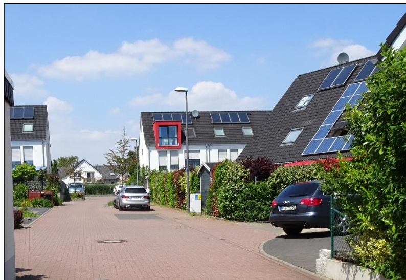
Sicht in Richtung Freunder Landstraße