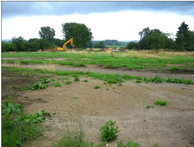
Baubeginn auf der Fläche des künftigen Wohngebiets