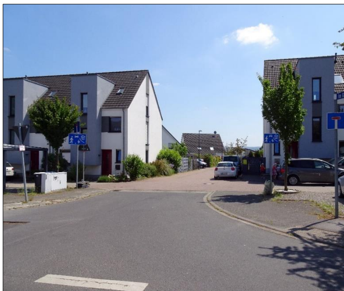
Zufahrt von der Freunder Landstraße in die Straße Im Gödersfeld