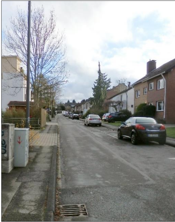
Blick vom nörd- lichen Teil der Straße Wolferskaul in die Straße