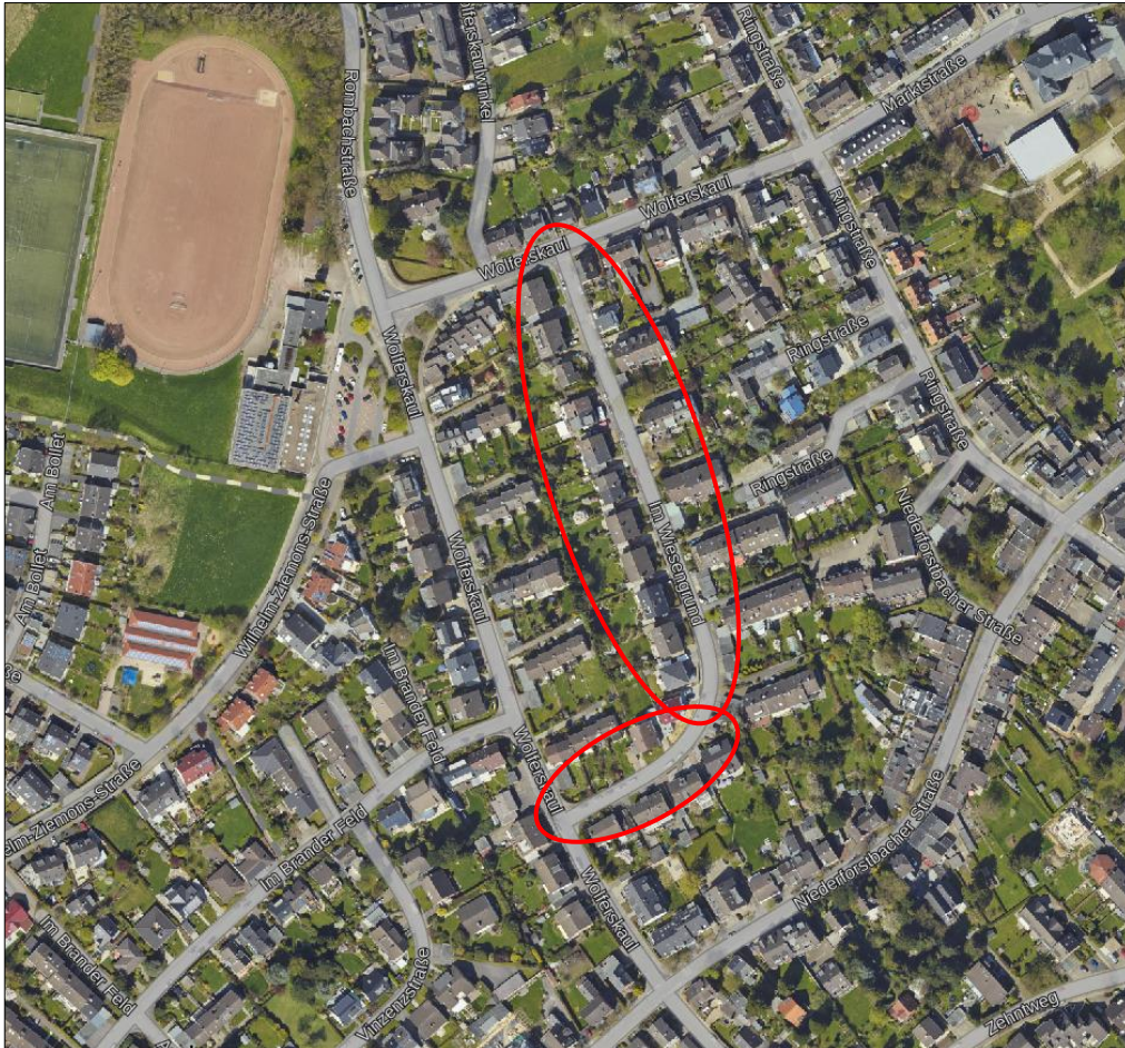
Luftbild Stadt Aachen: Die Daten basieren auf Auszügen aus dem ATKIS-Basis-DLM mit der Aktualität Dezember 2018 und dem Liegenschaftskataster (ALKIS) mit der Aktualität Juli 2018. (Land NRW)