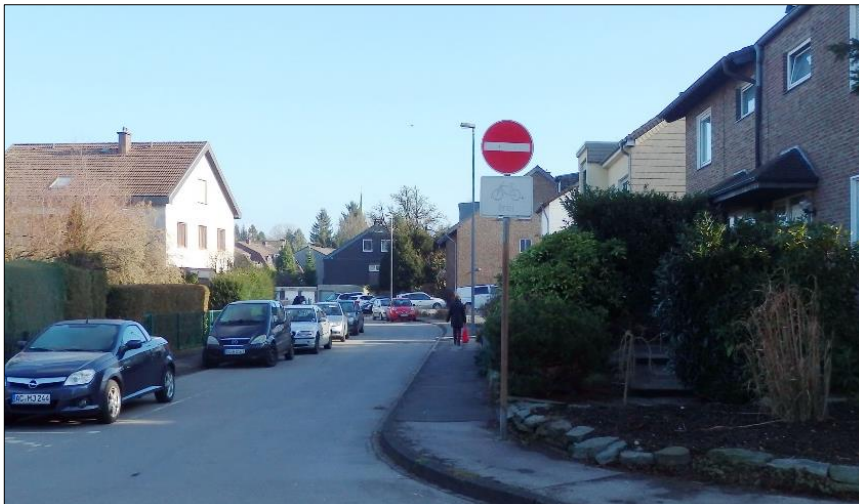
Blick vom südlichen Teil der Straße Wolferskaul in die Straße Im Wiesengrund