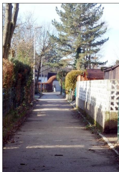
Blick in Richtung Buchenheck