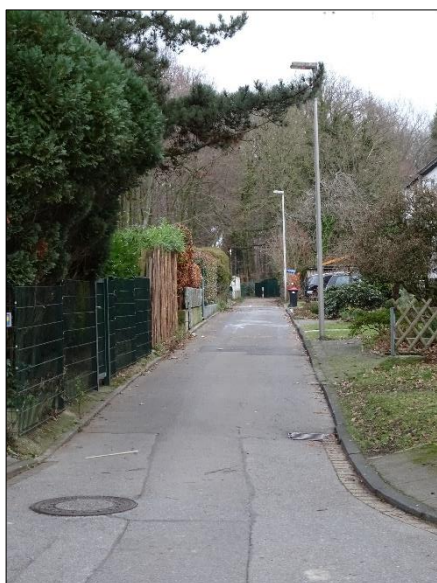
Ansicht in Richtung Wald