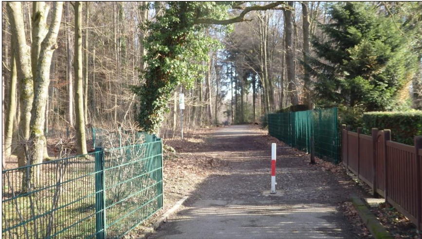
Weiterführung als Rad- und Gehweg in den Brander Wald