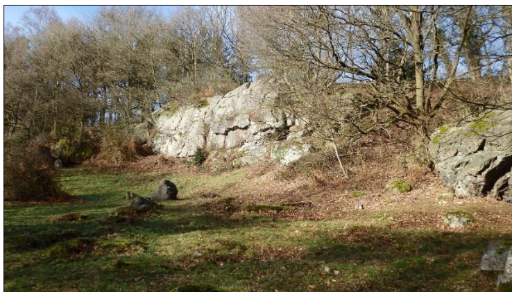
Die Steine in der Indetalaue, nach der der Weg benannt ist

sich im Indetal die vorgenannten Katzensteine, die heute als „Tatternsteine mit Talaue“ bezeichnet sind. 5