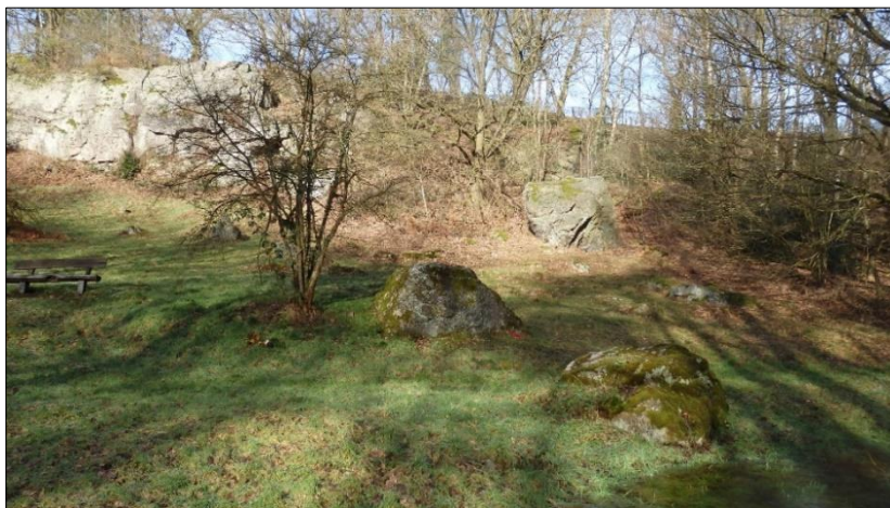
Katzen- oder Tatternsteine im Indetal bei Gedau

Heute ist die Straße Katzensteinweg als schmaler befahrbarer Weg eine Sackgasse in diesem Wohnbereich der Waldsiedlung, die östlich von der Straße Buchenheck in Richtung Brander Wald führt. Von dort aus erreicht man über den Waldweg das Indetal zwischen Gedau und Bocksmühle. Am östlichen Ende des Weges (Stadtgrenze Aachen und Stolberg) befinden