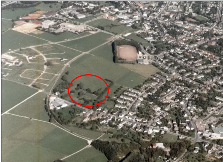
Luftbild Branderfeld – Niederforstbach; ehemalige Flurbezeichnung „Am Liefeweg“; die Lage des heutigen Liefenwegs (Markierung)