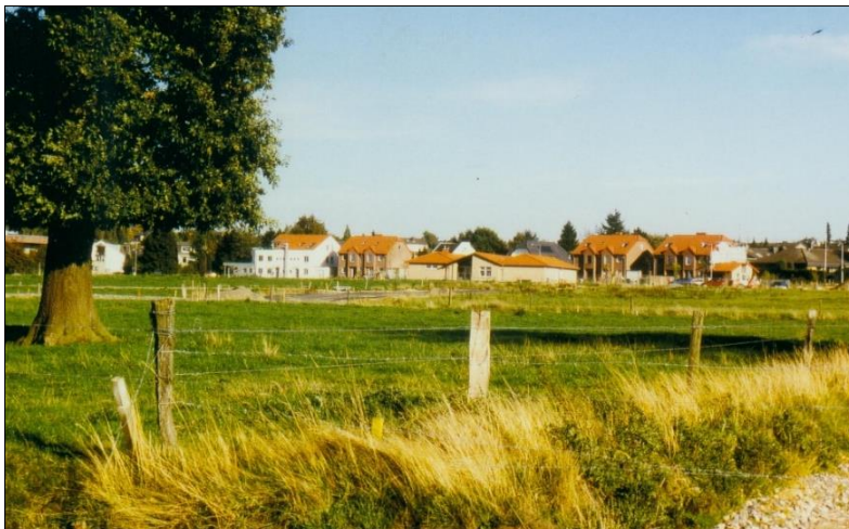
Die künftige Franz-Wallraff-Straße (Bildmitte) und der Liefenweg noch als Baustraße, am Horizont verläuft die Wilhelm-Ziemons-Straße mit ersten Häusern