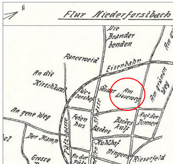
Auszug aus einer Skizze zum Bericht „Die Brander Ortslage nach den Flurkarten“ von Franz Wallraff (Stand 1936) 3

Franz Wallraff bezeichnet in seinen Skizzen die Flur mit „Am Lieseweg“.