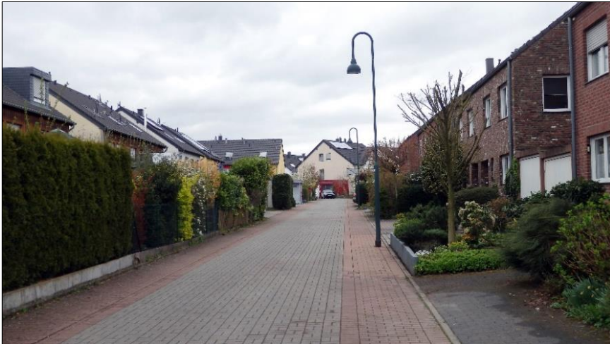
Blick in Richtung Wilhelm-Ziemons-Straße in den Liefenweg