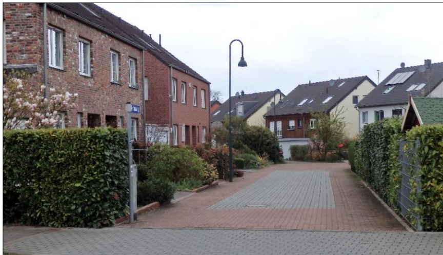
Blick in Richtung Franz-Wallraff-Straße