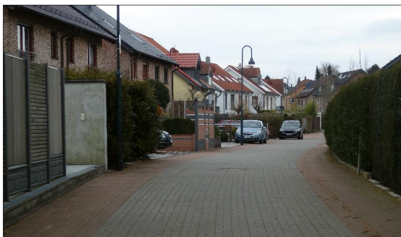
Blick aus der Straße in Richtung Wilhelm-Ziemons-Straße