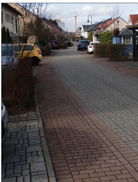
Blick von der Wilhelm-Ziemons-Straße in die Straße Membachweg