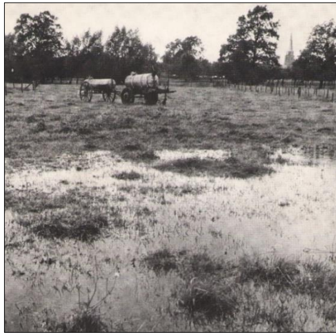
Im Kollenbruch in den 1960er Jahren